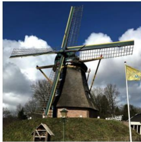
N 341 – Hammerweg