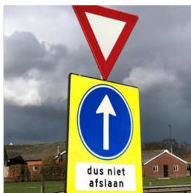
N 35- Nijverdalsestraat